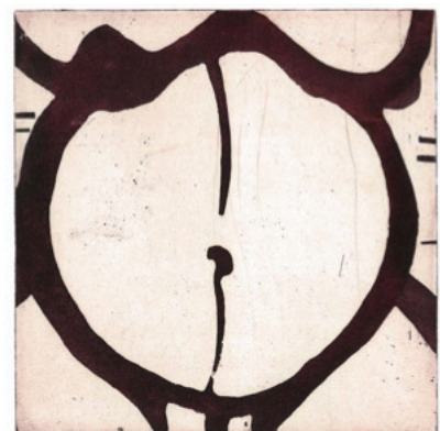
Sixième croissant descendant du mois des Graines